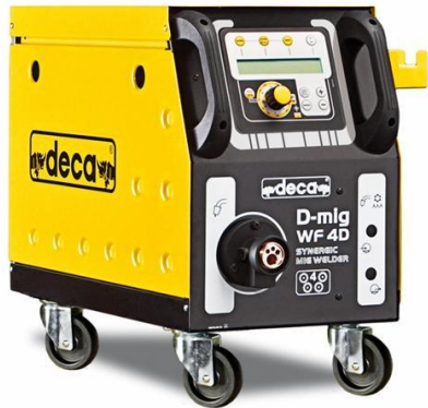
Naziv : dodavač za žicu WF 4D Cena : 82,425.00